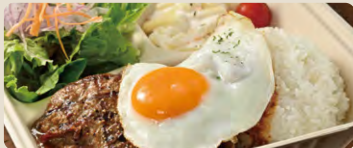
ロコモコ ... 1,600 yen