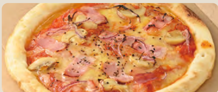
ピザ ... 1,000 yen