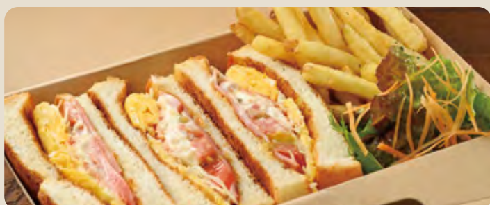
クラブハウスサンド ... 1,000 yen