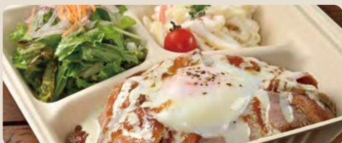
ローストビーフ ... 1,600 yen