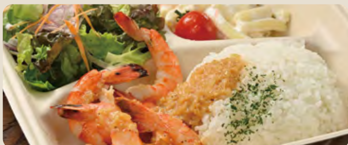
ガーリックシュリンプ ... 1,400 yen