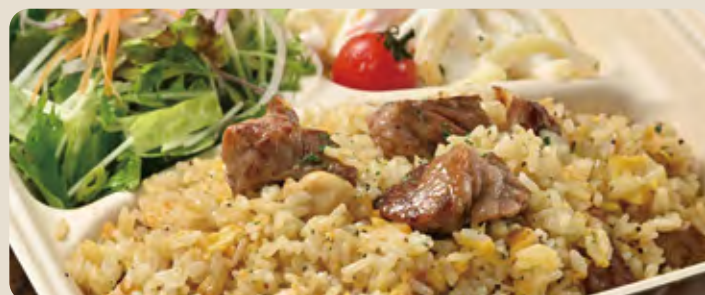
ビーフピラフ ... 1,600 yen