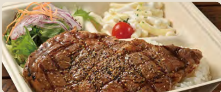
リブローズステーキ 200g ... 2,300 yen