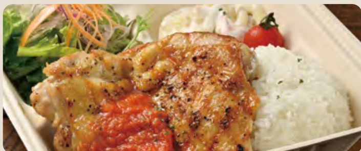
グリルチキン ... 1,400 yen